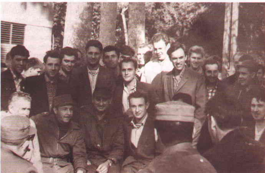
Министр революционных Вооружённых сил Республики Куба Р. Кастро (нижний ряд, второй слева) в кругу советских военнослужащих. Декабрь 1963 года