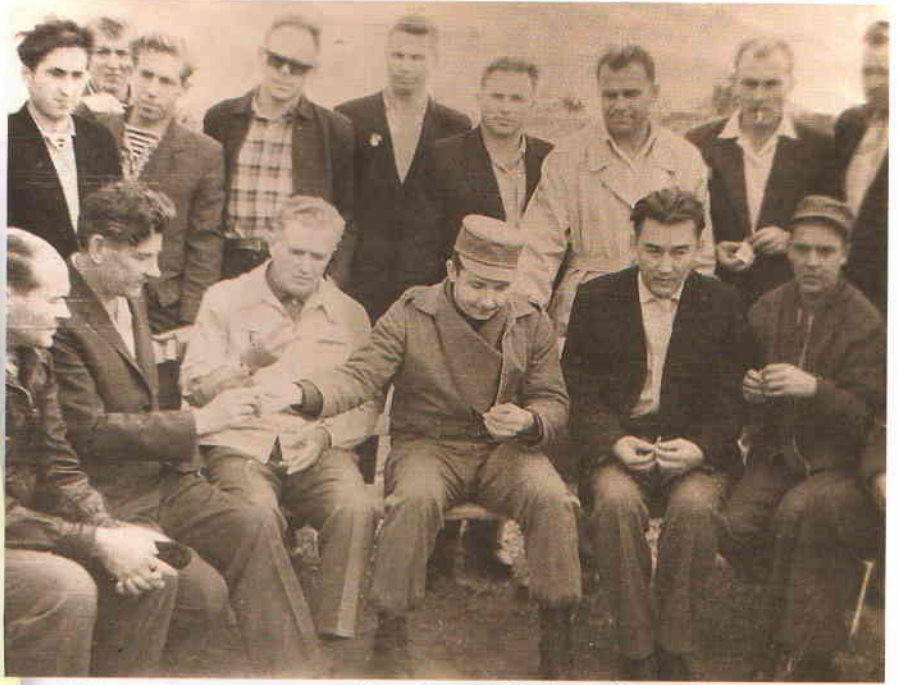
Министр Вооруженных сил Республики Куба Рауль Кастро Рус (в центре) с советскими специалистами. 1963