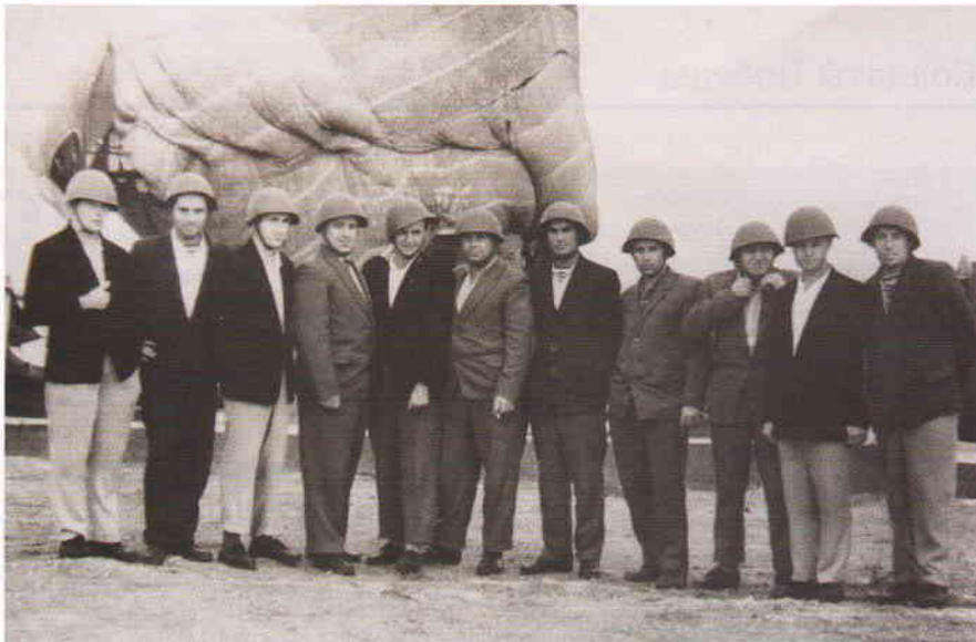
Фото на память на фоне замаскированной военной техники в день приезда Ф. Кастро в расположение советских «штатских» специалистов. Октябрь 1962 года

2 марта 2019 года на площадке Музея-мемориала В.И. Ленина в рамках выставочного проекта «Символы