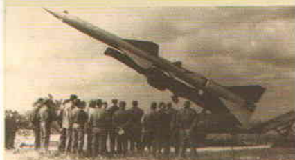
Советская ракетная техника на Кубе. 1962

В мае 1962 года политбюро ЦК КПСС приняло решение о размещении советских ракет на кубинской территории. Сверхсекретная операция под кодовым названием «Анадырь» предполагала переброску на Кубу пяти полков ракет Р-12 и Р-14, а также полка тактических бомбардировщиков Ил-28. Здесь были оборудованы 24 стартовые позиции пуска доставленных на Кубу ядерных ракет ближней и средней дальности. Для прикрытия с воздуха туда же должны были отправить две дивизии войск ПВО и полк МиГов-21. Оперативная группировка советских войск на Кубе составила в общей сложности около 44 тысяч человек личного состава. К их переброске было привлечено более 80 единиц гражданских торговых судов под флагом СССР. Ракеты и другую военную технику, а также личный состав доставляли на Кубу из разных портов – от Североморска до Севастополя. Советские ракеты на кубинской территории могли держать под прицелом Вашингтон и около половины авиабаз стратегических ядерных бомбардировщиков ВВС США с полётным временем менее 20 минут.