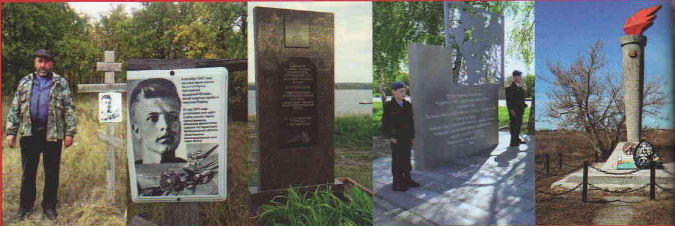
На могиле героя