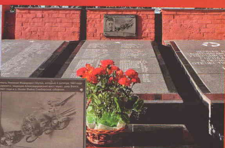
Мемориальная доска Шутова

показал, что они имели задание, кроме ведения разведки, разрушить сызранский железнодорожный мост через Волгу.