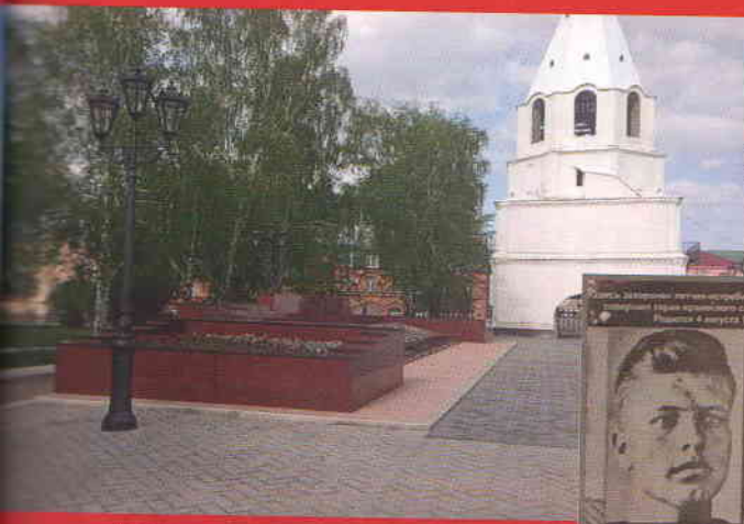
Мемориал на территории кремля в Сызрани