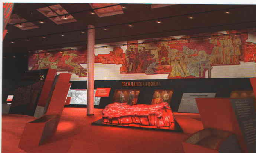
Напольная карта из рубинового стекла «Триумфальное шествие Советской власти». Художник И. Рублёв

сверхспособностями, ни даром предвидения, ни возможностью определить вектор развития «на века», так как революционные потрясения в начале XX века запустили механизм, который оказался неподвластным ни одному человеку в мире. Он отрицал существующую государственную си-