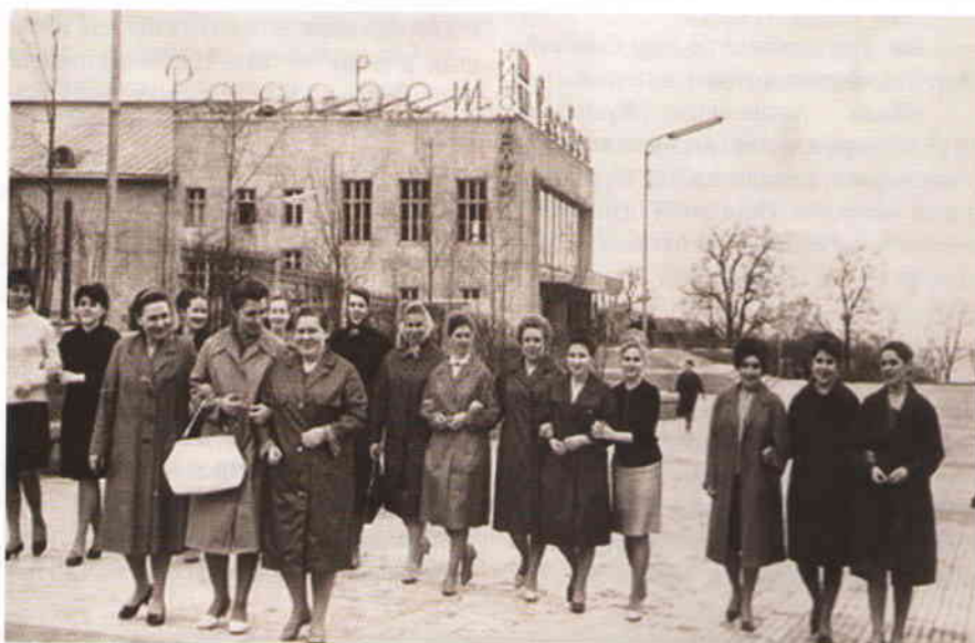
У кинотеатра «Рассвет». 1970-е

ник Ульянову-Ленину работы скульптора Манизера как стоял, так и будет стоять на площади.