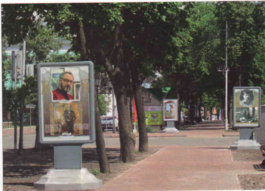
«Аллея культуры. Ульяновск, ул. Гончарова. 2012