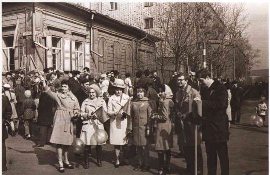
Первомайская демонстрация. Женщины в популярных сапогах-чулках. 1972

Несчётное количество банков, больших и малых, вытеснили с главной улицы города множество недоро-