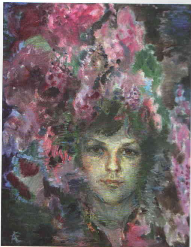
↑ Сирень. 2000