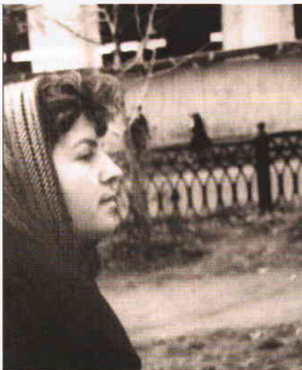
Сквер на ул. Гончарова с ныне не существующей чугунной изгородью

Многие прекрасные уголки нашего города уже утрачены, они остались лишь в памяти старшего поколения. И мне хочется поделиться некоторыми воспоминаниями детства, рассказать о любимых улицах.