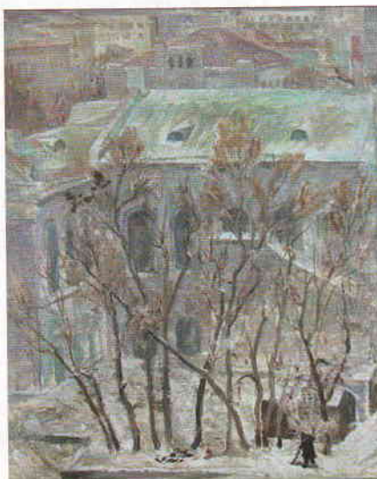
«Театр кукол со двора. 1983

Вот что сообщает о нём Симбирская-Ульяновская энциклопедия.