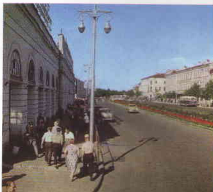
Знаменитые «Столбы» (Симбирские торговые ряды) в центре Ульяновска