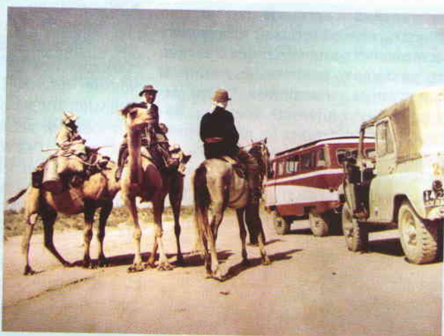
Автомобили Ульяновского автомобильного завода им. В.И. Ленина на северных и южных широтах СССР. 1980 г.

Визитной карточкой Ульяновской области являются автомобили УАЗ. Они давно завоевали известность не только в нашей стране, но и далеко за её пределами. Уазики – вечные труженики, которые могут пройти по любым дорогам. На этих снимках мы видим наши внедорожники в сугробах, рядом с северными оленями и среди песков, рядом с кораблями пустыни – верблюдами.