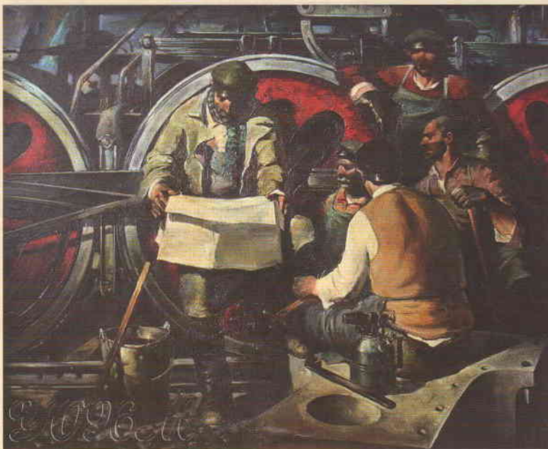
Цхондия Т.И. (1947–1986). Накануне. 1977 (Грузинская ССР)