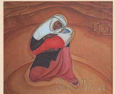
Невежин Е.В. (1937). Колыбельная. 1970 (Казахская ССР)