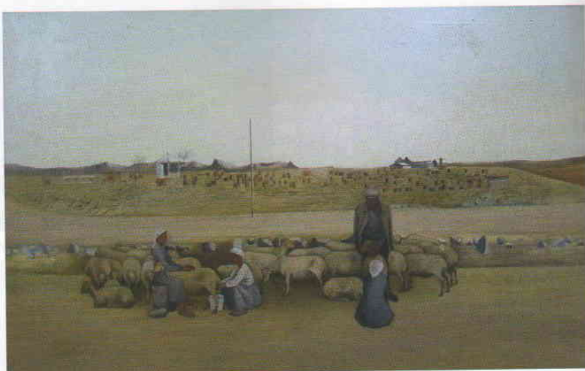
Акопян А.Т. (1923–2013). Трудники земли. 1975 (Армянская ССР)

В 1960–1980-е годы в СССР проводились многочисленные зональные, республиканские и всесоюзные выставки, способствовавшие взаимообогащению социалистических культур. Республиканские союзы художников совместно с Союзом художников СССР и Академией художеств СССР активно поддерживали творчество молодых художников: организовывали командировки по стране, проводили масштабные молодёжные выставки, содействовали обучению в крупнейших вузах Советского Союза. Для искусства этого времени характерно гармоничное сочетание национальной самобытности и интернационалистских идей, объединяющих народы СССР.