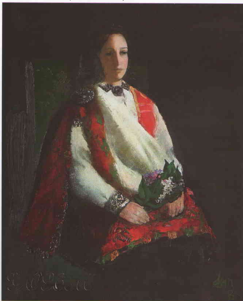
Заринь И.А. (1929–1997). Народный костюм. Портрет жены. 1986 (Латвийская ССР)