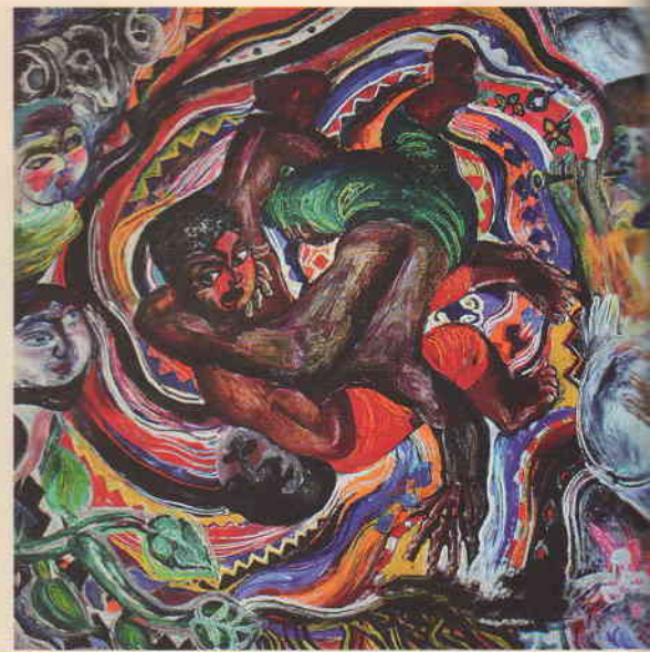
Нариманбеков Т.Ф. (1930–2013). Пехлеваны. Азербайджанская народная борьба. 1979 (Азербайджанская ССР)