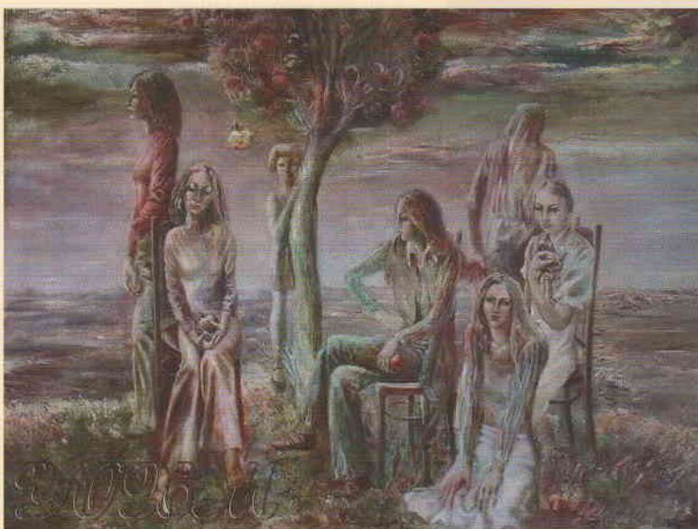
Тохтаев М.М. (1947–2004). Сад Эдема. 1978 (Узбекская ССР)