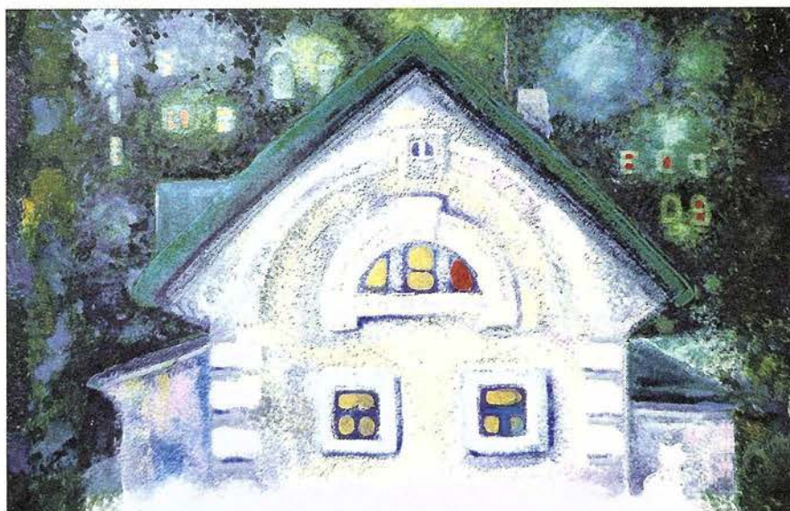
Л.А. Иванова. Под зеленой крышей. Компьютерная графика, печать на холсте, кисть, акрил, лак. 2010