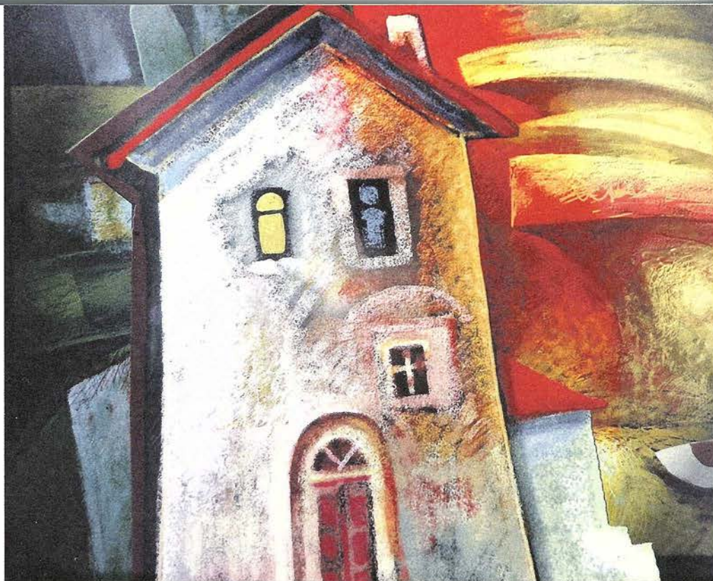
Л.А. Иванова. Мое красное. Компьютерная графика, печать на холсте, кисть, акрил, лак. 2011

Компьютерные работы и акварели могут меняться местами, а могут, напротив, доказывать свою собственную значимость и оригинальность. Тогда компьютер – только средство для созда-