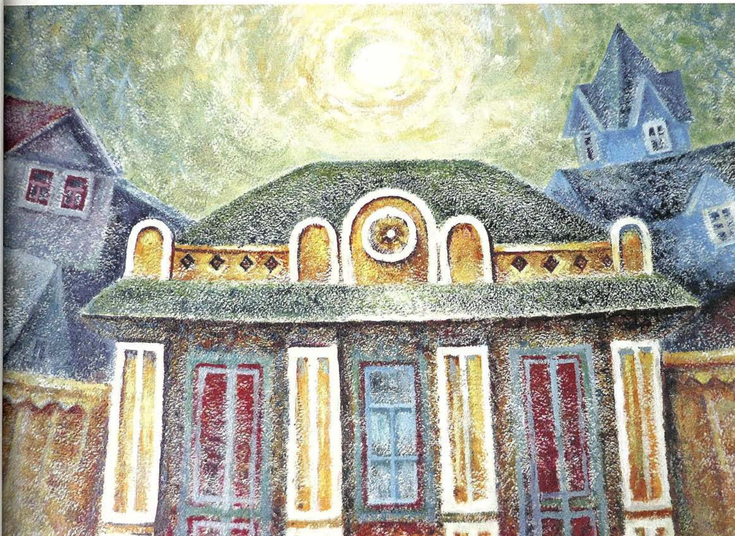
Л.А. Иванова. Солнышко на улице Ленина. Бумага, сухая кисть, акварель, акрил. 2011

ть ия го- ый сь им. эн- де- ы! бы вь, ! эн- с от- му. им е- но за- му е- то у- ом не е, н- о- ом ой а). та е, ту