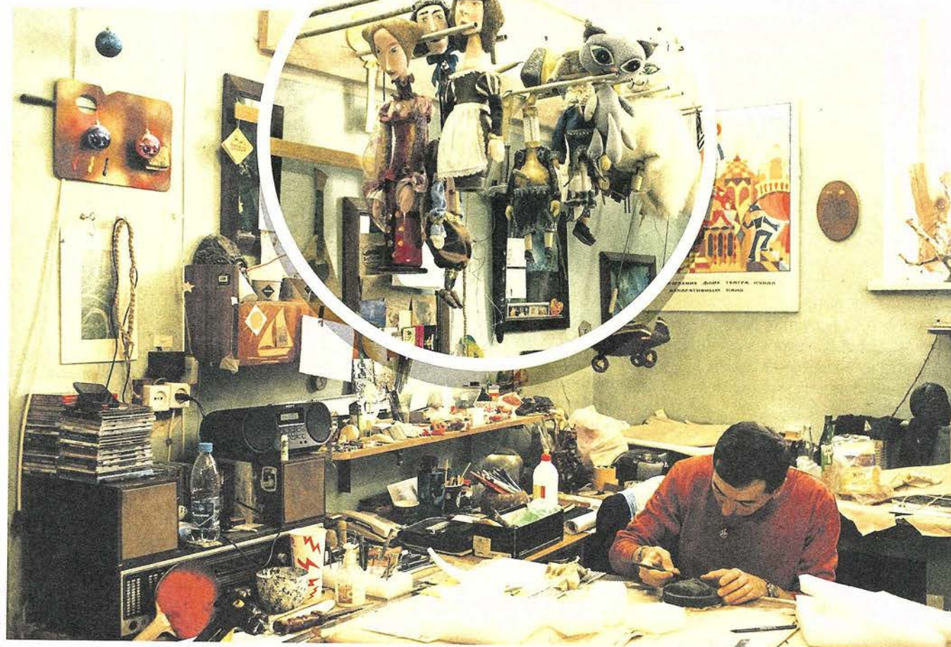
Производственные мастерские Ульяновского театра кукол