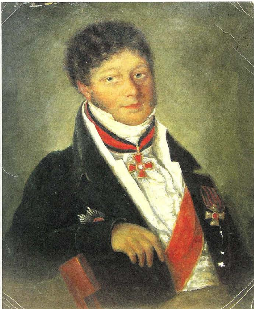
Петр Никифорович Ивашев (1767–1838). Портрет из собрания Ульяновского областного краеведческого музея имени И.А. Гончарова