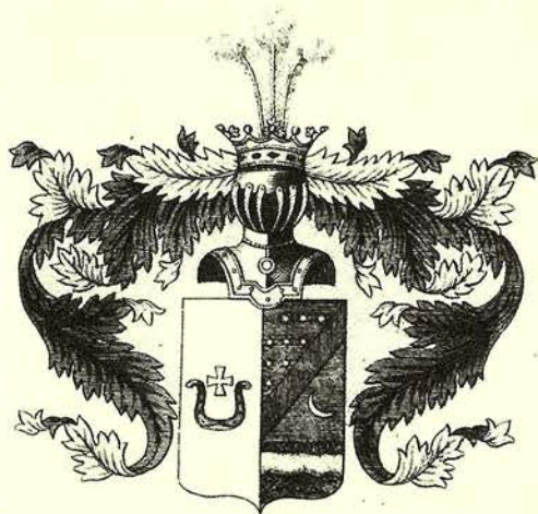
Герб рода Ивашевых. IV часть «Общего гербовника дворянских родов Всероссийской империи». 1799