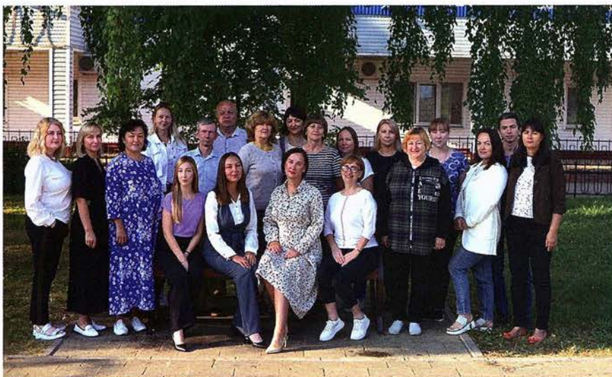
Коллектив контрольно-ревизионного блока управления