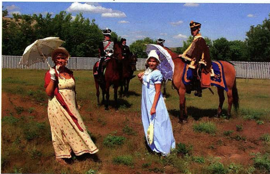
Верхняя Маза. 2019