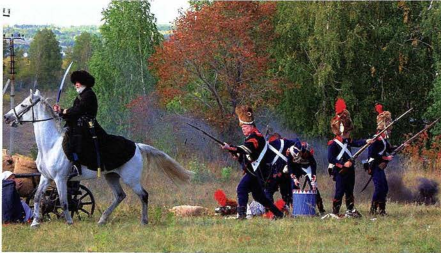
На военно-исторической реконструкции. 2021