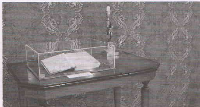
В витринах были представлены редкие книги

Из фонда областной научной библиотеки были для экспозиции предоставлены книги с автографами Николая Некрасова и Ивана Гончарова.