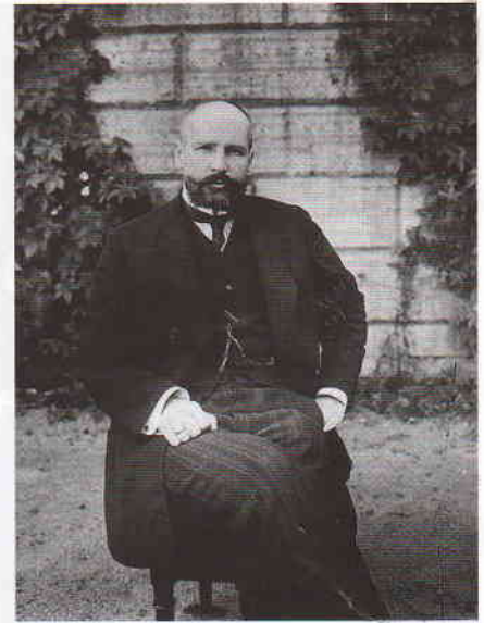
П.А. Столыпин. 1906