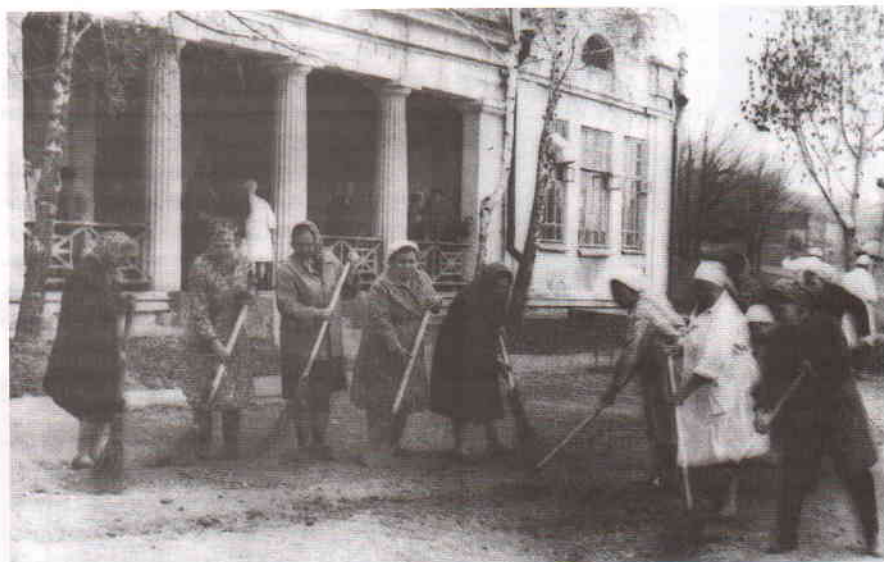
Копосов павильон. 1960-е годы

Карамзинки прогулки назывались «водить больных на солнце».