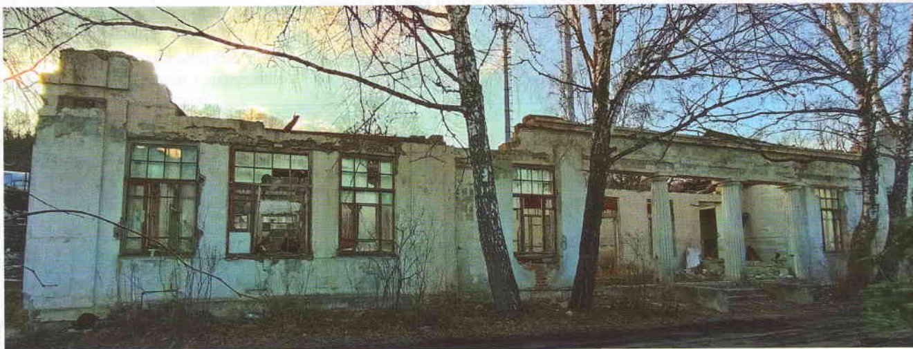
Главный (восточный) фасад «Копосова павильона». 2023

История «Копосова павильона» началась 2 марта 1913 года, когда директор Карамзинской колонии