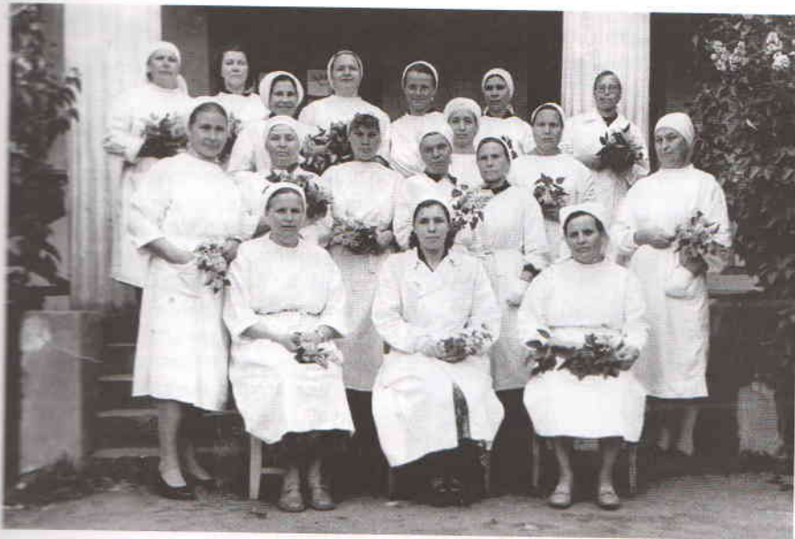
Персонал «Копосова павильона» с букетами белой сирени. 1950-е годы