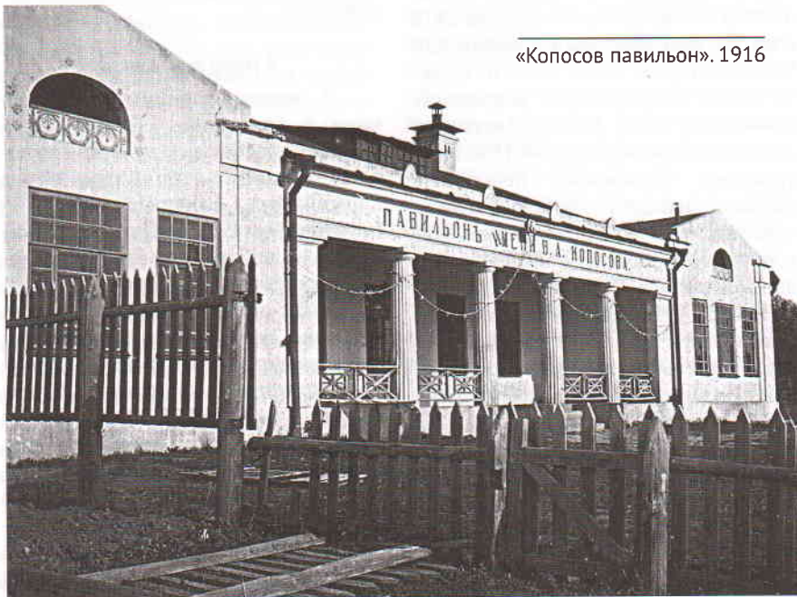
«Копосов павильон». 1916

На крутом склоне правого берега Волги, между ульяновским плёсом Куйбышевского водохранилища и карамзинским лесом, в обрамлении фруктовых садов укрылась от глаз ульяновцев старая Карамзинка (нижняя площадка).