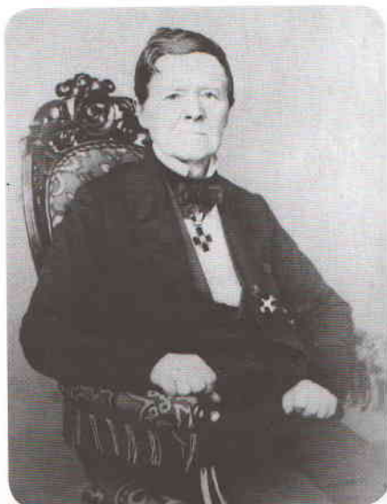
Густав Адольф фон Гросшопф (1797–1862?) (брат бабушки В.И. Ленина, основатель прибалтийской ветви Гросшопфов)