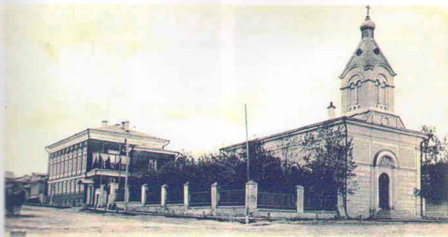
Lutheranska Kirkan. Eglise luthérienne.