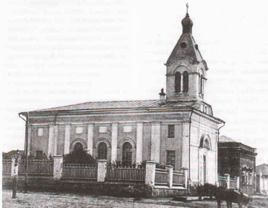
Евангелическо-лютеранская церковь святой Марии. Фото 1867–1868 годов

В 1900 году на пожертвования прихожан община приобрела у семьи Арнольдовых новый участок земли с юга от церкви. В начале XX века территория храма представляла собой огороженный деревянным забором земельный участок с