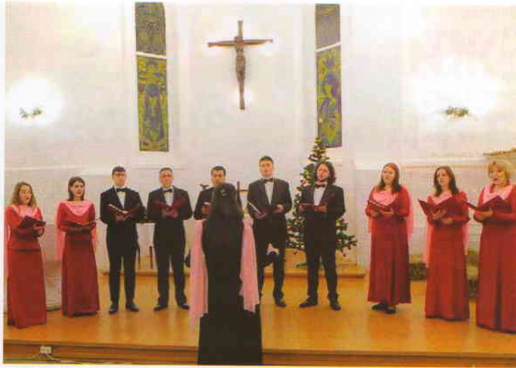
Рождественский концерт. Фото 2022 года