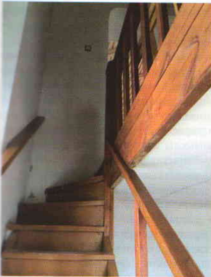
Лестница, ведущая на хоры

Во время Гражданской войны многие прихожане покинули город.