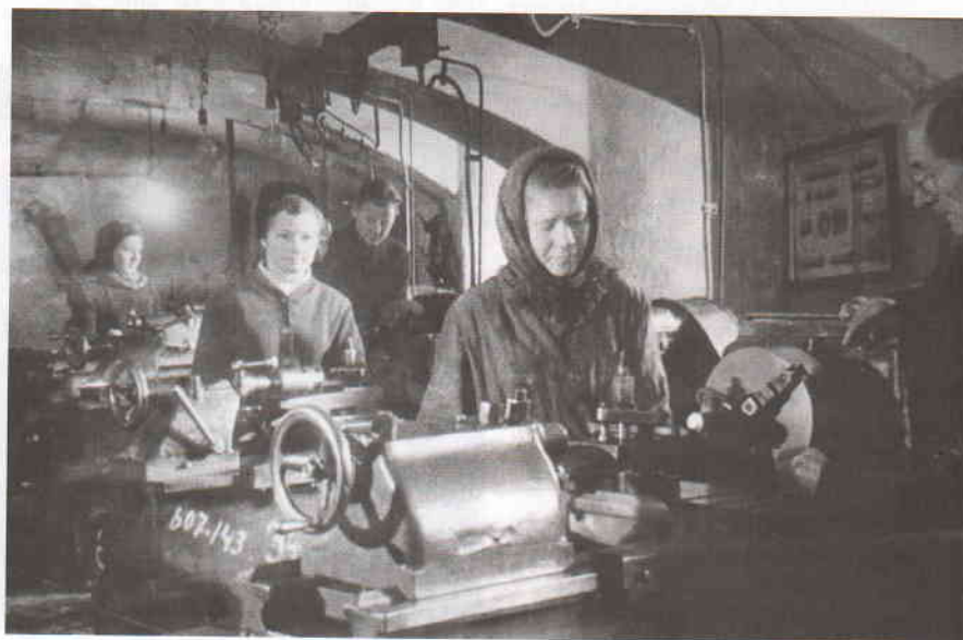
Работа на станках в лаборатории механообработки. 1949

Организуется электротехническая лаборатория, изготавливается и закупается новое учебное оборудование и наглядные пособия. Силами студентов и преподавателей активно производится космети-