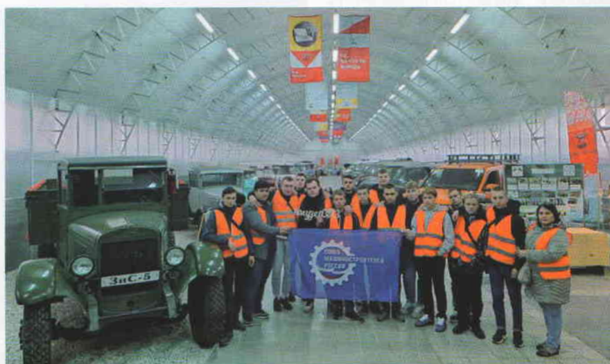
Экскурсия студентов в музей Ульяновского автозавода

При поступлении в Ульяновский автомеханический вечерний техникум выполнялись следующие правила: возраст обучаемых от 14 до 25 лет (на вечернее отделение без отрыва от производства – без ограничения возраста); образование – 7 или 10 классов средней школы; экзамены для поступающих: русский язык (устно и письменно – диктант), математика (устно и письменно), Конституция СССР (устно).