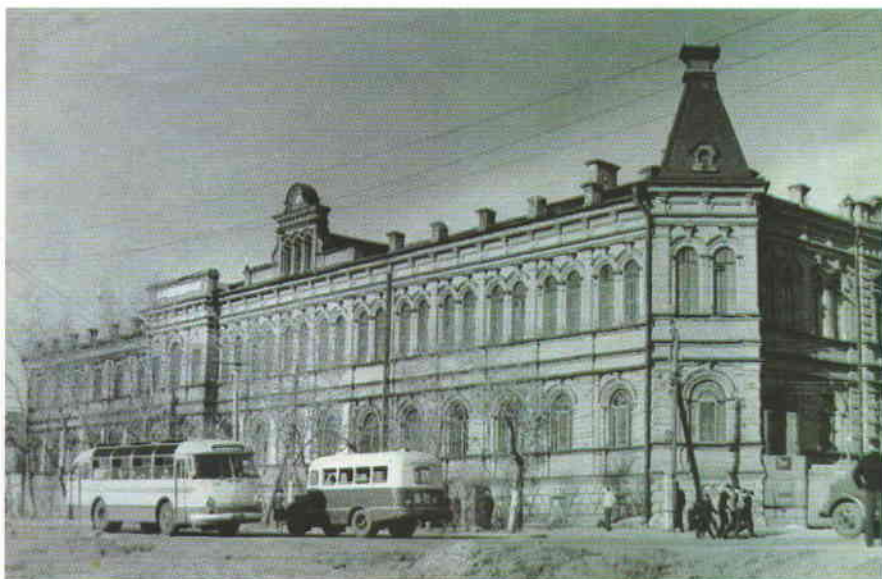
Здание УАМТ. 1970-е годы