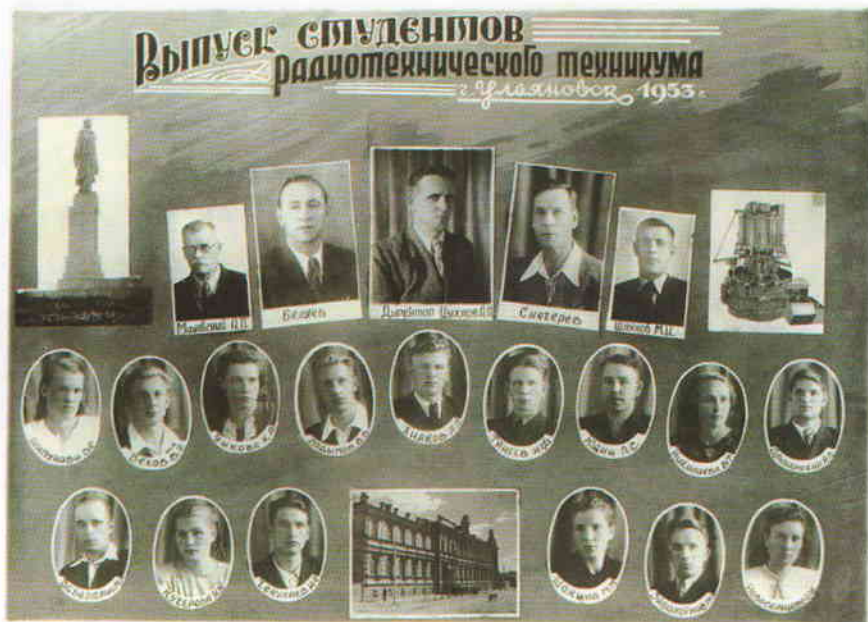
Радиотехникум, выпуск 1953 года

К началу 1960 годов техникум прочно занял место в ряду лучших