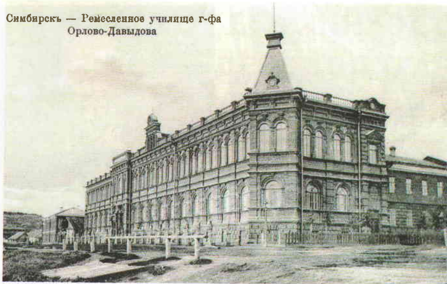
Здание ремесленного училища. 1902