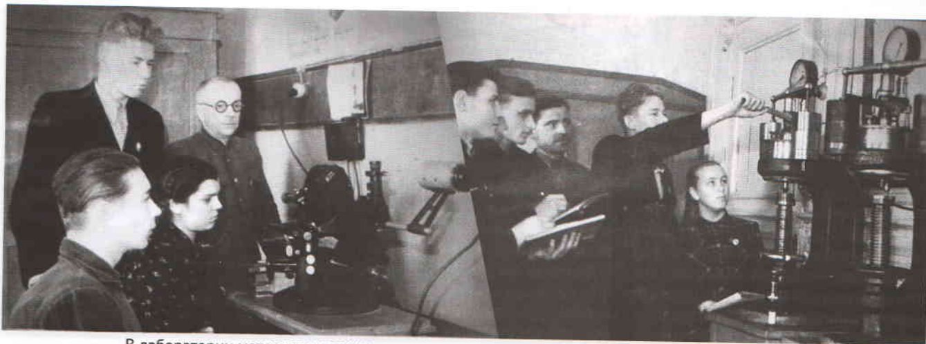
В лаборатории материаловедения