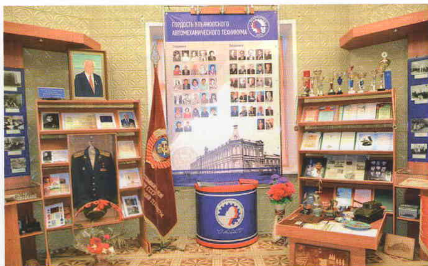
Музей истории УАМТ