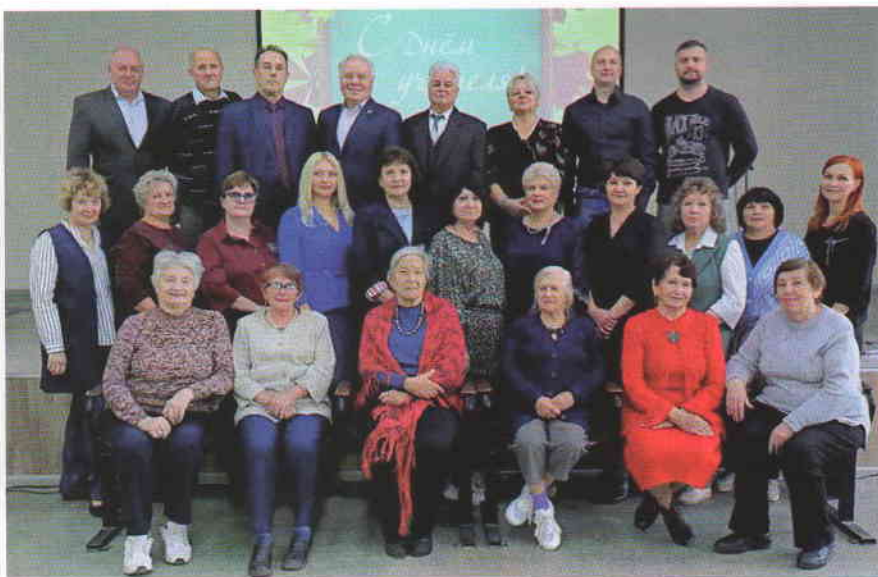
Встреча с ветеранами техникума. 5 октября 2023 года