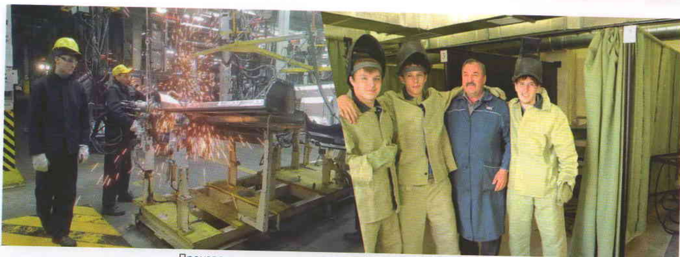
Производственная практика на УАЗе. Сварочная мастерская

ского государственного университета (УлГУ).