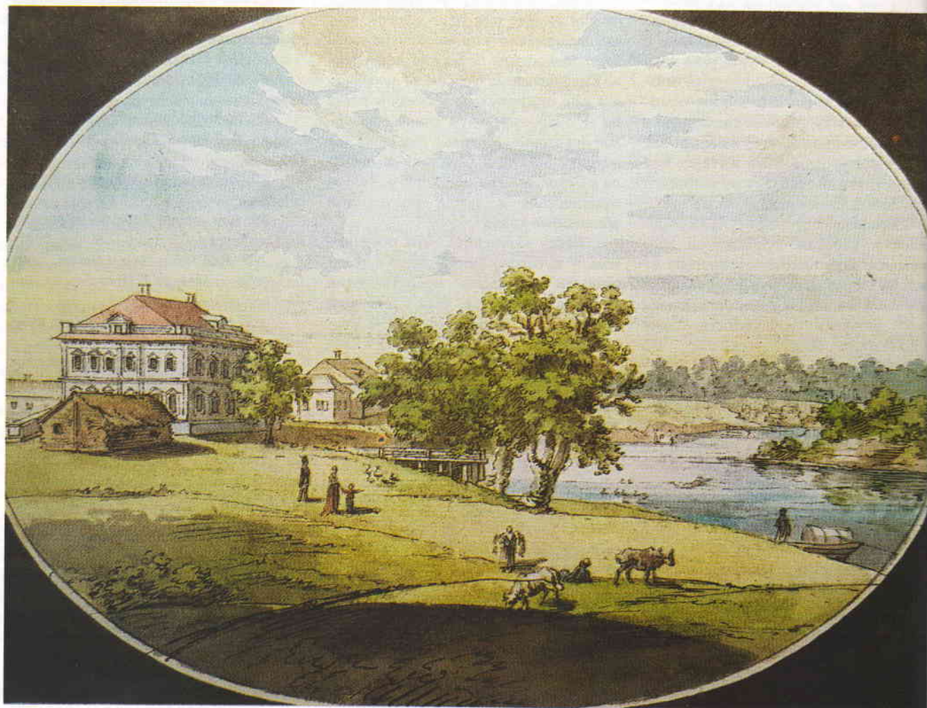
Вид Ишевки (имение генерала Ивашёва), рис. Ем. Корнеева

Однако дальнейшая работа над рисунками из собрания Музея архитектуры привела к необходимости подвергнуть сомнению исходное предположение об авторстве Корнеева. Связано это с тем, что один из рисунков под названием «Разработка соли в Илецкой защите», который присутствует в альбоме архитектурных пейзажей музея, нашёлся среди гравюр, хранящихся во Все-