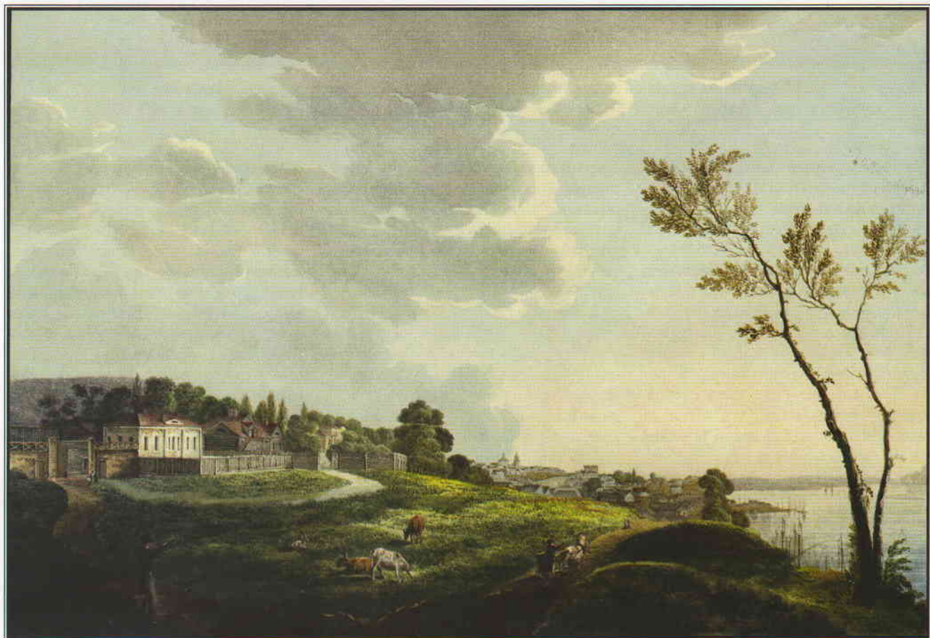
Самара. Из альбома архитектурных пейзажей.

Несколько слов о том, как делались зарисовки пейзажей в то время. Обычная практика заключалась в изготовлении на месте карандашного рисунка, который потом раскрашивался в условиях мастерской. Нужно иметь в виду, что художник для поиска хорошей точки для обзора должен был затратить время и усилия. Сам Свињин так описывает трудности, возникающие при этом, на примере создания панорамы Златоустовского завода: «С немалым трудом пробрался я сквозь густой лес до крутого утеса, служащего как бы венцом сему гиганту, и взору моему представилась ни с чем не сравнимая панорама. Златоустовский завод, в семи верстах отсюда отстоящий, казался гнездышком пернатых, прикрепленных к ущелью гор, которые гордо смотрелись в чистые воды пруда, омывающего их подошву». («Отечественные записки». Ч. 22, 1825 г.).