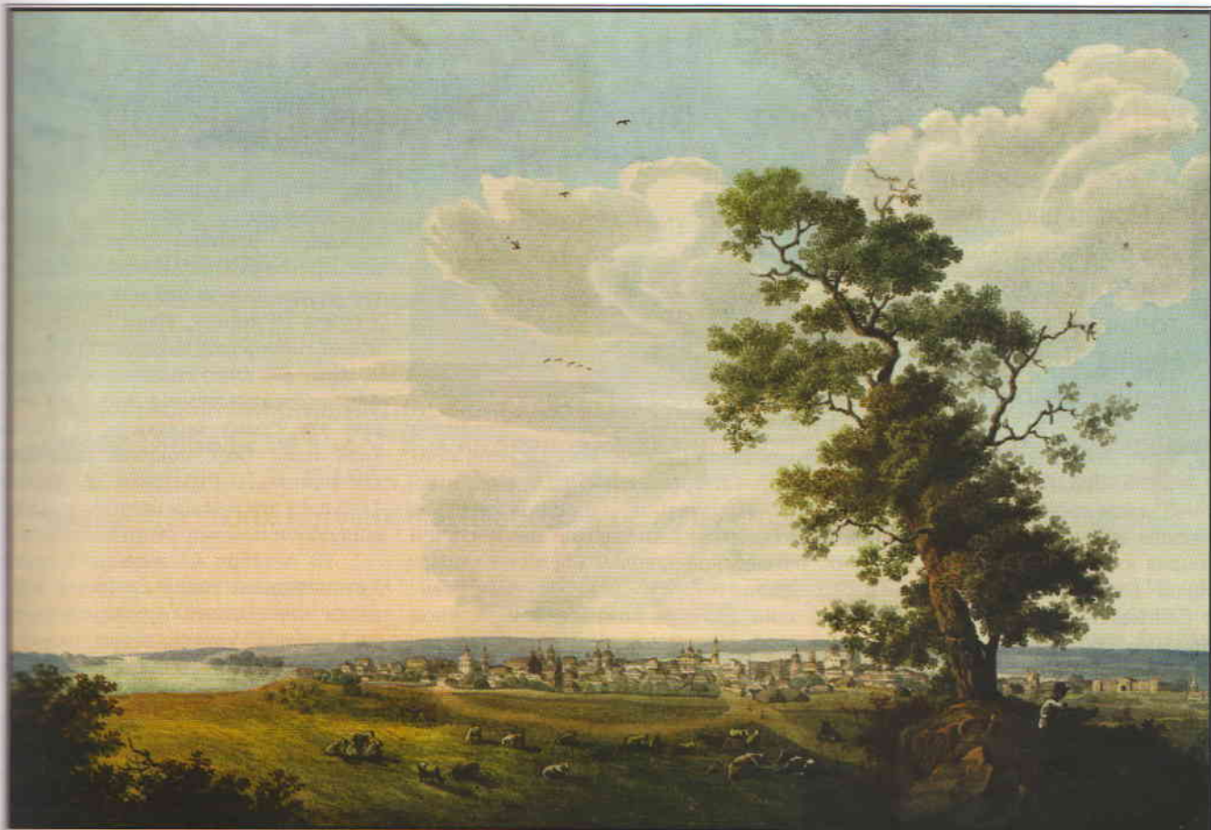
Синбирск от Московской заставы. Из альбома архитектурных пейзажей. Бумага, тушь, акварель, белила. 17,1x24,4 см (рисунк). Музей архитектуры им. А.В. Щусева. Инв. Р 1-9837

Тем не менее надо понимать, что пейзажи Свиньина в значительной степени идеализированы и не являются точной топографической съёмкой. Его задача была показать какие-то необычные для столичного европейского взгляда виды российской провинции, в этом смысле его задача уже исходно была направлена на некоторую идеализацию неизведанной земли.