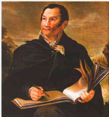
Портрет П.П. Свињина (автор – О.А. Кипренский)

Что касается рисунка Симбирска, то мы можем датировать его июлем 1823 года, когда П.П. Свињин проехал по Волге, оставив заметки и