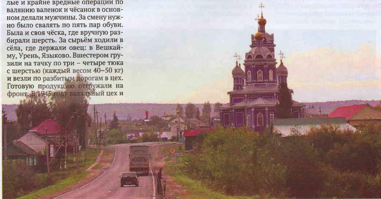
Село Оськино

Работа над проектом «Города и поселения Ульяновской области» продолжается. Ведётся сбор материалов для третьего тома. Институт истории и культуры региона ОГАУК «Ленинский мемориал», Союз краеведов Ульяновской области приглашают жителей региона к сотрудничеству. Просим присылать свои воспоминания, фотографии, интересные документы из личных архивов (сканы или фотокопии). Мы будем рады использовать их в работе и опубликовать в издании. Убедительная просьба: по возможности точно датировать фото и документы и пишите, кто изображён на фотографиях (e-mail: kraeved73@mail.ru ).