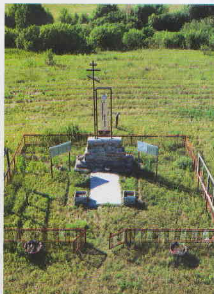
Памятный знак на месте исчезнувшей деревни Зимнёнские Выселки