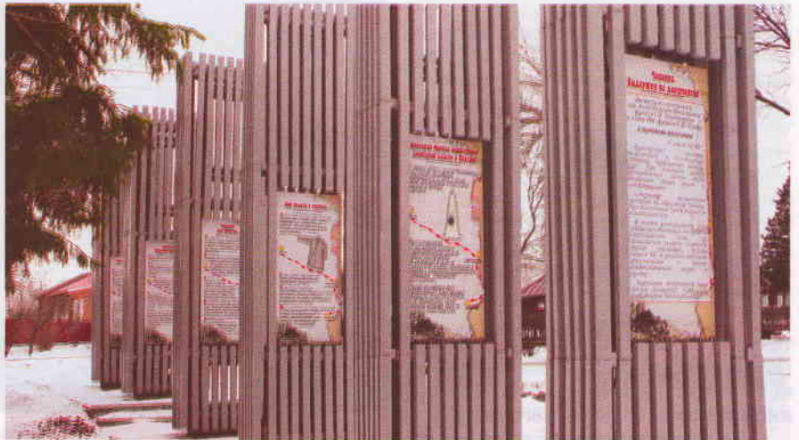
Памятник жертвам чапанного восстания в Карсуне. 2019

В марте 1919 года Карсун и станция Вешкайма стали одними из центров крестьянского чапанного восстания. Оно получило название по зимней крестьянской одежде домашнего изготовления – чапану и распространилось на многие сёла Симбирской губернии. Крестьяне выступили против жестокости и несправедливости реквизиций скота, продразвёрстки и чрезвычайного налога. Борьба с обеих сторон велась самыми крайними средствами. В Вешкайме 19 марта 1919 года повстанцы разоружи-