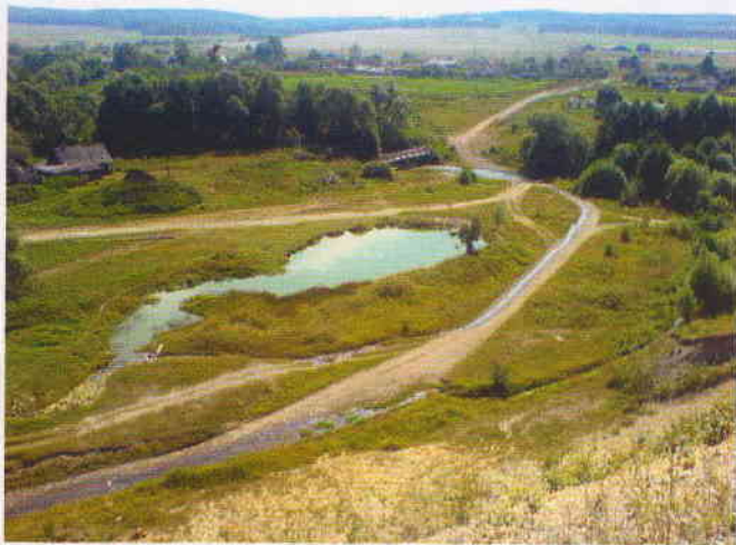
Вид на село Палатово