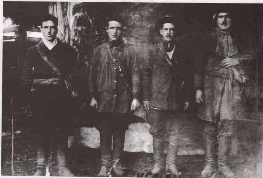
Дракинские коновалы. 1931

В 1970 году в результате разукрупнения совхозов был организован совхоз «Белозерский» с центром в с. Белозерье (Карсунский р-н). Совхоз имел 2700 голов КРС (в т. ч. 1100 коров), 30 000 свиней, 4500 овец, 4000 птиц, более ста лошадей. Ежегодно совхоз производил 2500 тонн молока, около 700 тонн мяса, 14,5 тонны шерсти. Овцеферма была лучшей в области. С 1976 года совхоз стал специализироваться на выращивании лука с полной механизацией всех процессов. Общая площадь семенников лука доходила до 120–130 га. С начала 1980-х годов здесь впервые в области начали внедрять семейный подряд. По догово-