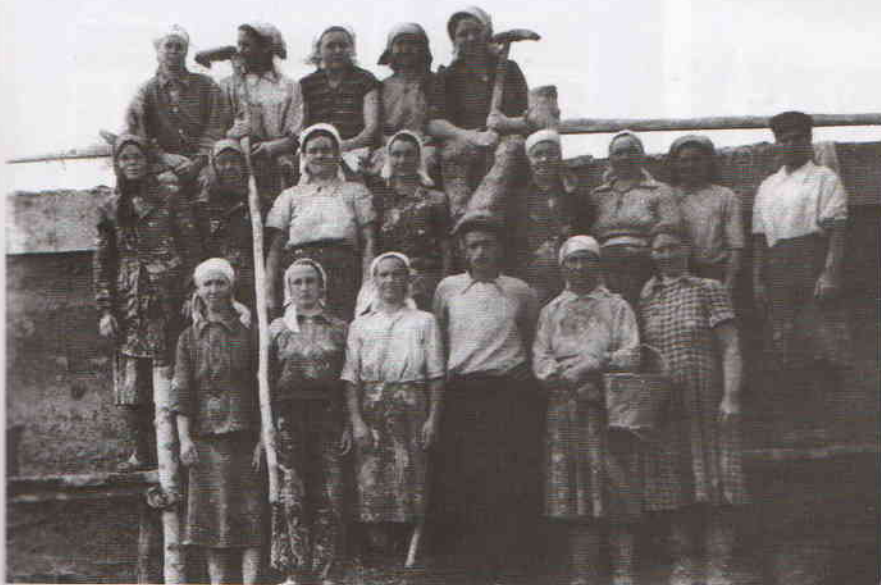
Бригада колхозников села Старое Погорелово в годы войны

В Инзенском крае славу центра деревообработки снискали Аргаиш и окрестные селения: здесь издавна изготовляли сани-розвальни, в Чумакино , к примеру, гнули полозья, в Палатове делали колёса для телег (включая спицы, станы).