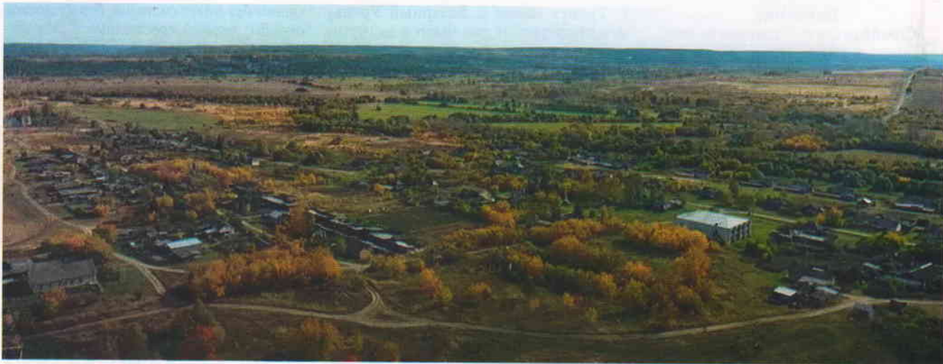
Вид на село Большая Борисовка

ли группу продотрядников, изымавших в пользу государства большую часть урожая. К ним присоединились многие жители села. Совместно с повстанцами из соседних сёл и деревень они участвовали в штурме Карсуна, но были отброшены и бежали. Крестьянские отряды не могли сдерживать натиск красноармейцев и были разгромлены. Однако чапанка заставила правительство большевиков пересмотреть политику в отношении крестьян.