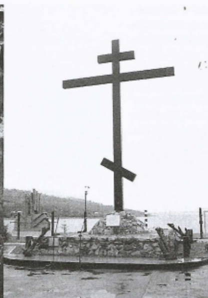
Крест и памятная табличка в память о жертвах трагедии на теплоходе «Александр Суворов»