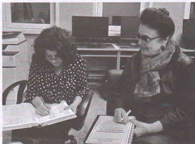
Автограф в книге почётных гостей. Центральная городская библиотека им. И.А. Гончарова