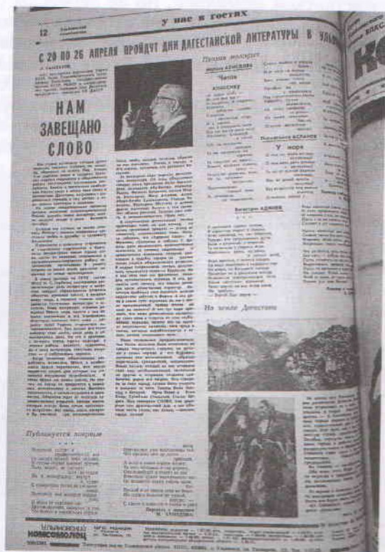
«Ульяновский комсомолец». 18 апреля 1987 года