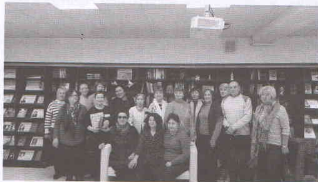
Встреча в библиотеке №17

Встречи прошли в нескольких модельных библиотеках города и области. В специализированной библиотеке №17 «Содружество», в Центральной детской модельной библиотеке р.п. Чердаклы Ульяновской области.