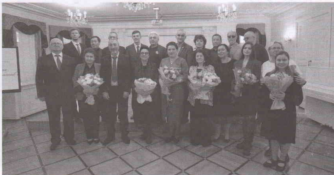
Участники торжественного вечера

Надеемся на страницах «Симбирска» и впредь знакомить наших читателей с талантливыми дагестанскими авторами. Мы благодарны коллегам и друзьям из Дагестана за приезд и тёплые встречи! Верим, что дружба и творческие контакты Ульяновска и Республики Дагестан будут продолжены.