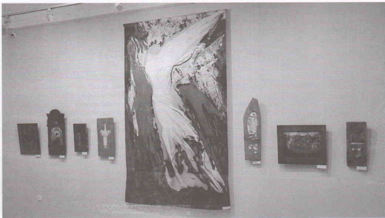
Панно «Ника» в экспозиции выставки Ольги Лысенковой

созданные в венгерском городе Кечкемет, где находится всемирно известный центр эмальерного искусства. Одна из значительных монументальных работ этого времени – бережно хранимый занавес Большого концертного зала Ульяновского государственного технического университета (текстильный коллаж, размер 180 кв. м).