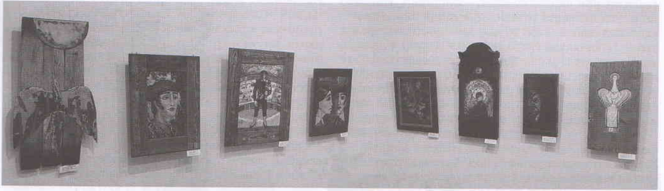
Экспозиция персональной выставки Ольги Лысенковой «Избранное». Ульяновск, музей изобразительного искусства XX–XXI вв. 2023