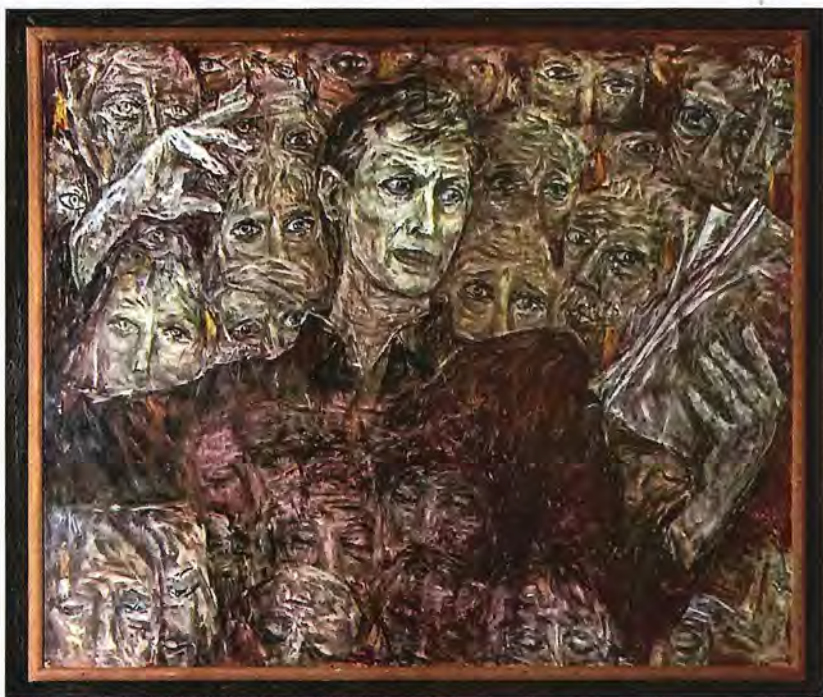
Бабий Яр. Посвящение Евгению Евтушенко

услуг, содержание семьи... Заказы, в том числе и социальные, прекратились. Много сил потребовалось, чтобы продлить пользование мастерскими на 10 лет. Позже продлили уже на 49 лет. Но сколько нервов! Утром иду по кабинетам начальников – возвращаюсь, уже не в силах взять кисть в руки. Но мы не сбавляли темпов работы и сохранили творческий потенциал. В организации было уже более 90 живописцев, скульпторов, дизайнеров – люди яркие, талантливые. Участвовали в международных, всероссийских и межрегиональных выставках в Саранске, Нижнем Новгороде, Чебоксарах, Самаре, Москве, Минске, Польше, в международной ассамблее художников «Пластовская осень». Широко отмечали юбилеи организации, 90-летие Аркадия Пластова. Залы областного драмтеатра и Дворца профсоюзов битком набиты. Провести все эти мероприятия непросто. А сколько безвозмездных акций на счет нашей организации! Мы дарили картины госпиталю ветеранов, больницам, домам культуры, школам, детскому реабилитационному центру. Пересчитать стоимость в рублях – огромные суммы.