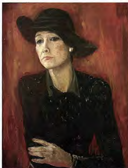
Бэлла Ахмадулина. Из цикла «Поэты России»

шу и перекрытия этажей – баснословные деньги. Опять дело встало. Но было принято постановление Совета министров об увековечении памяти А.А. Пластова, и это помогло. Ульяновский обком возглавил уже Г.В. Колбин. Мне позвонили, что он идёт со всем своим бюро на Гончарова, 16. Он