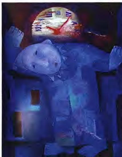
Несущий часы. Из цикла «Смешные несмешные человечки»

Сейчас обидно слышать, что здание на ул. Гончарова, 16 художникам подарил Г.В. Колбин. На стенде, где изложена история этого здания и музея