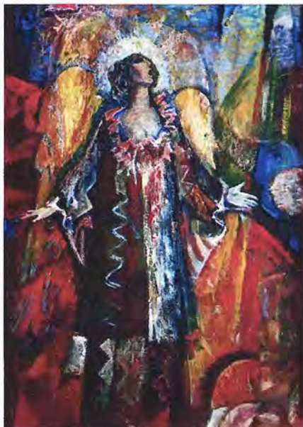
Поющая. Посвящение Елене Камбуровой

Внимание знаменитого художника заставило меня поверить в себя. Пластов написал письмо в Ульяновский облисполком с просьбой помочь молодому дарованию. Кое-как я дождался весны. В Прислониху меня привёз отчим и высадил чуть дальше по тракту. Иду по пыльной улице... Мандраж. Рядом летит ворона. Взлетит – сядет на обочину, ждёт меня, снова летит. А я был птичник заядлый, у меня сразу возникла ассоциация с синей птицей. Успокаиваю себя: всё будет хорошо.