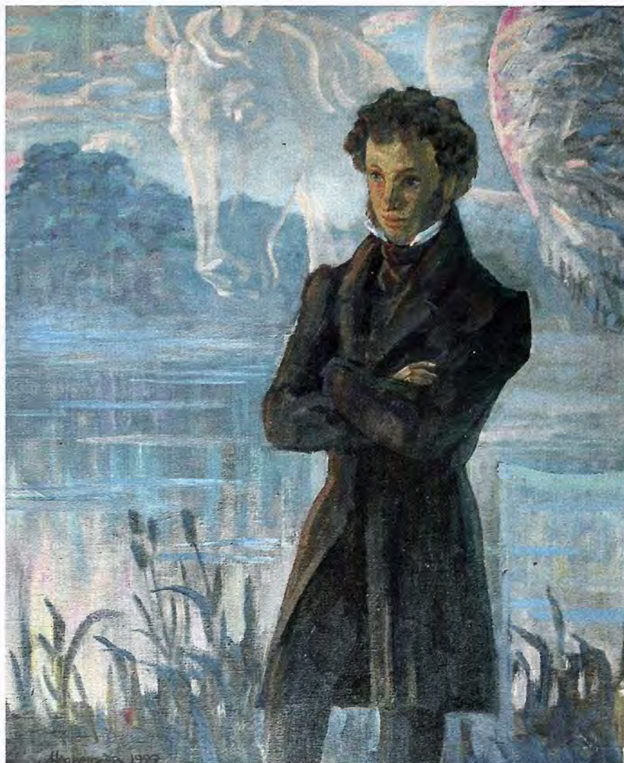
Лев Нецветаев. Элегия. Холст, масло

Род Анненковых принадлежал к старинным дворянским