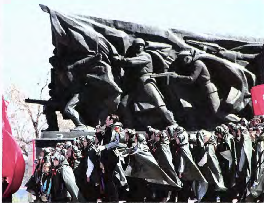
Герои праздника у монумента Айрапетяна

В скульптуре возникает новая концепция пространства – физическое пространство осмысливается как эстетическая категория, равнозначная скульптурному объёму. Отсюда создание особого интерьерного поля, некоей сценической площадки. На этом пути многие молодые скульпторы, когда обращались к историче-