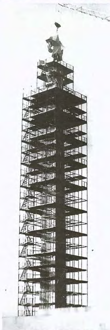
Возведение стелы, 1974

Пятигранный, светлый обелиск Славы, увенчанный объём-