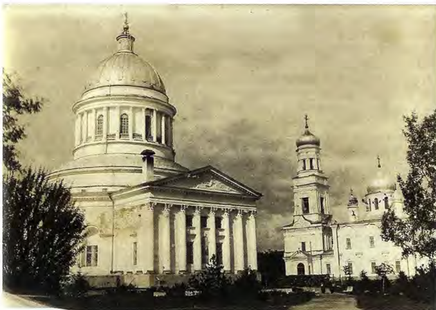
Свято-Троицкий кафедральный собор. Симбирск. Уничтожен в 1936 году

27 апреля 2004 года на площади Ленина состоялась панихида по четырём усопшим симбирским архиереям, честные останки которых пребывают под спудом на месте, где предполагалось строительство. В своём кратком слове архиепископ Симбирский и Мелекесский Прокл сказал: «Для одних собор – это памятник искусства, для других – духовное начало... Если есть трудности, значит дела идут» 1 .