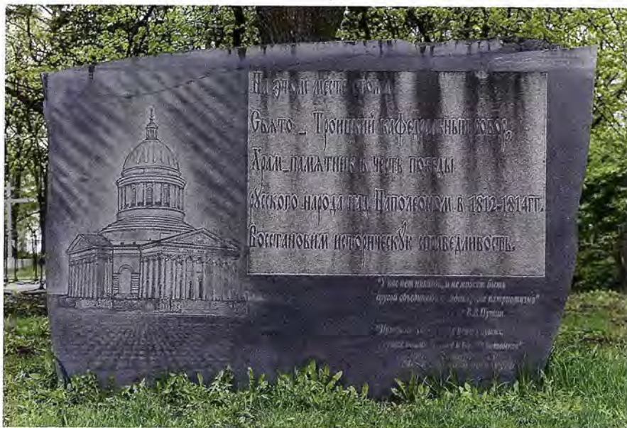
Памятник-камень на месте утраченного Троицкого собора. Поставлен в 2018 году

Тогда началось соборное публичное чтение акафиста святым Царственным страстотерп-