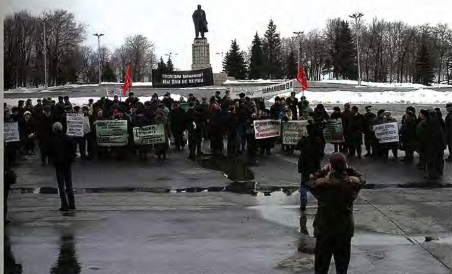
Митинг протеста при губернаторе В.А. Шаманове

5 апреля 2005 года местные СМИ сообщили, что на градостроительном совещании в администрации области вместо храма было решено устроить фон-