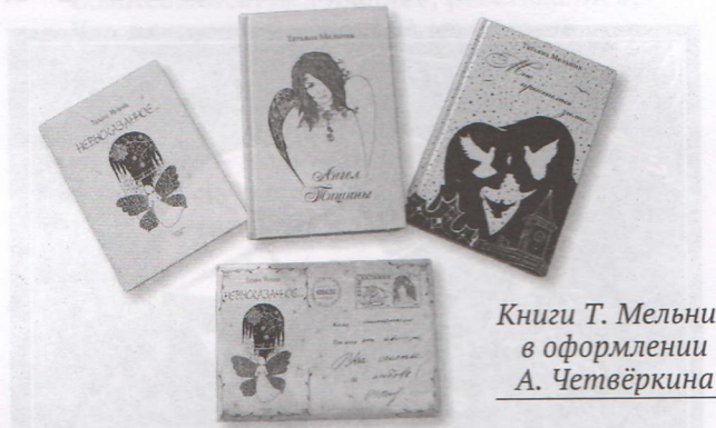
Книги Т. Мельник в оформлении А. Четвёркина

Для Александра оформление книги – своей ли, чужой ли – не сводится к иллюстрированию. Александр сначала вживается в текст, проживает его, пропускает через себя, заболевает им, и начинается молниеносный поиск из тысячи вариантов