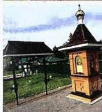
Город Киржач Владимирской области