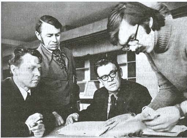
Выставком городского кинофотоклуба