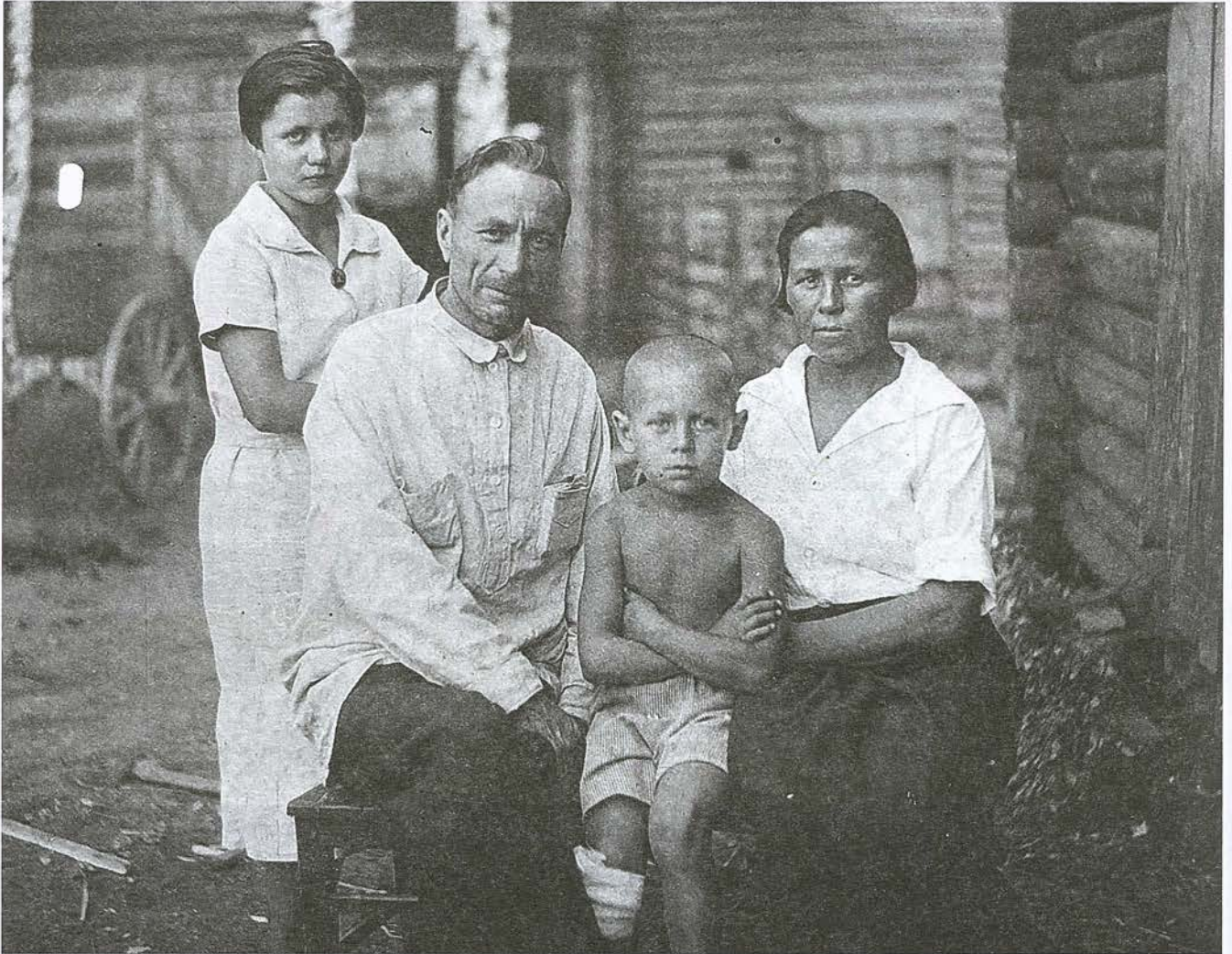
В детстве с семьёй.