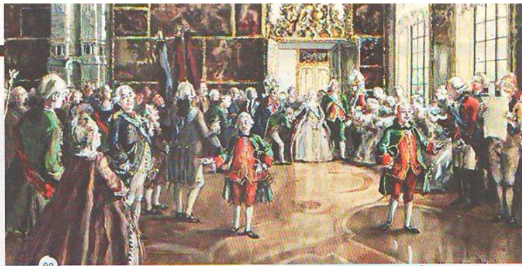
А. БЕНУА. ПОВЛЕНИЕ ЕКАТЕРИНЫ ВЕЛИКОЙ В ЦАРСКОМ СЕЛЕ. ФРАГМЕНТ